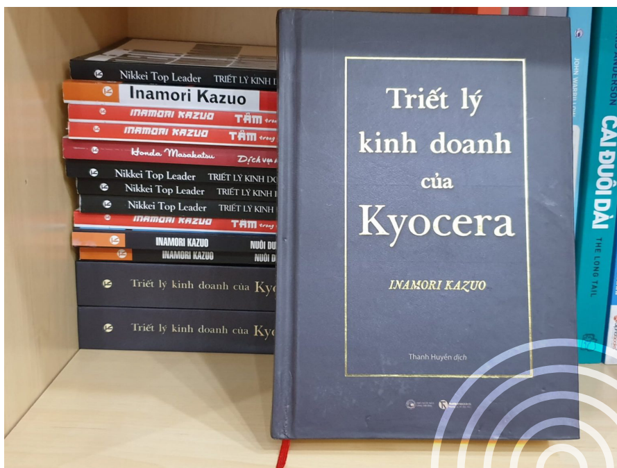
Sách “triết lí”, hay sách “nguyên lí”

Ví dụ, nhà quản trị cầm sách “Triết lí kinh doanh Kyocera” lên và đọc được nguyên lí gói trong công thức mà tác giả gọi là Công thức cuộc đời. Công thức được viết ra: Thành tựu = Tư duy * Nhiệt tình * Năng lực; với giá trị của từng tham số Tư duy từ -100 đến 100, Nhiệt tình từ 0-100; Năng lực từ 0-100. Người đọc không dễ gì vận dụng được ngay. Để vận dụng được, nhà quản trị buộc phải nghĩ ra tiếp một thang đo thế nào là tư duy -100 điểm, khi nào thì tư duy được đánh giá 10 điểm, khi nào thì tư duy được đánh giá 100 điểm, vì sao? Tương tự như thế với Nhiệt tình, và Năng lực. Như thế là từ nguyên lí, nhà quản trị đã xây dựng được thêm một bộ quy tắc để áp dụng nguyên lí này vào thực tiễn. Xong rồi nhà quản trị lại phải tiếp tục đặt ra tình huống khi nào thì sử dụng công thức kia: dùng cho mình hay cho nhân viên đang làm việc, hay nhân viên tiềm năng đang tìm việc ở công ty, hay nhân viên chuẩn bị được thăng chức. Từng tình huống như thế sẽ đòi hỏi phải đánh giá lại nhân sự có sử dụng công thức kia. Đó chính là cách “đọc” một nguyên lí. Nó bao gồm việc nắm bắt nguyên lí đó, hiểu sâu nó để đề xuất ra được một loạt “quy tắc”, và rồi đưa vào các “tình huống” vận dụng công thức đó.